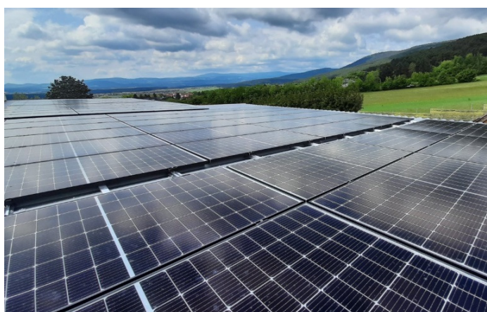
▲ Die Photovoltaikanlage am Dach der WellnessWelt wird in den kommenden Wochen weiter ausgebaut.

Bezüglich einer weiteren großen PV-Anlage am Areal des Bauhofs wurden bereits die infrage kommenden Dachflächen mithilfe einer